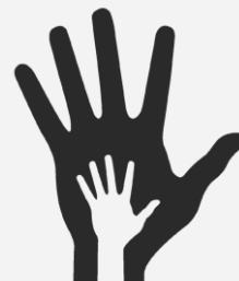
Enti del Terzo Settore